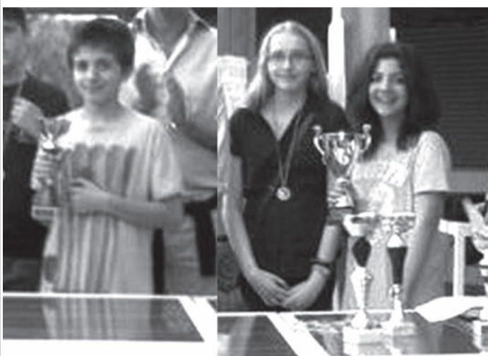
AD ITRIA SCACCHI